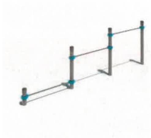
French triple push bar