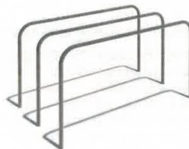
Triple parallel bars