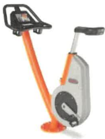
Vélo city bike