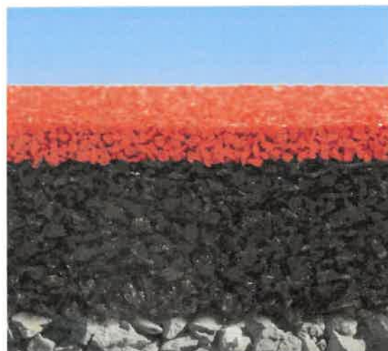
Illustration en coupe du revêtement antichute

Hauteur de chute HIC : 280 cm. Épaisseur totale : 90 mm. Granulé noir SBR : 40 mm. Couche MAX : 40 mm. Granulé EPDM de couleur : 10 mm. Couleur brique 062 - RAL 3016 Pose : sur planie en gravier