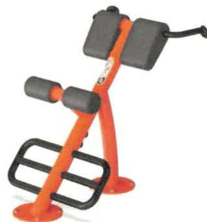
Entraîneur du dos