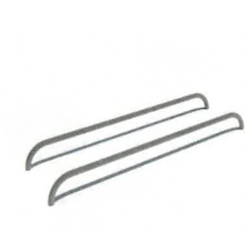
Ground Parallel Bars