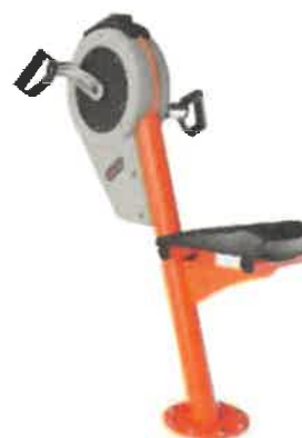
Vélo de bras