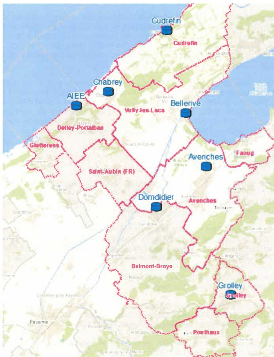
Figure 1 : Les communes du périmètre de régionalisation et leurs stations d'épuration (STEP)

Les objectifs du comité de pilotage sont les suivants :