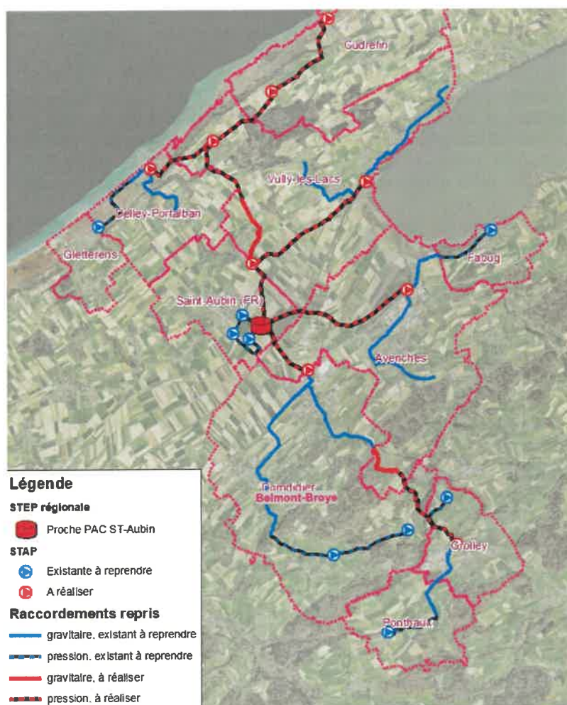
Figure 3 : Réseaux de raccordements à la STEP régionale EBBV

A ces réseaux projetés (en rouge sur la figure 3) s'ajoutent des ouvrages existants qui seront repris par l'association EBBV (en bleu sur la figure 3). Ils comprennent 26.2 km de canalisations gravitaires et 11.2 km de conduites de refoulement, neuf STAP existantes (Corsalettes, Ponthaux, Chandon, Léchelles, Faoug, Gletterens et St-Aubin (trois ouvrages)) ainsi que les ouvrages de prétraitement de la STEP de Grolley.